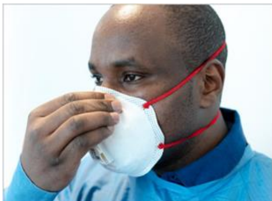
Ryc.6. Dopasowanie metalowego klipsa na nosie

Metalowy klips na nos musi zostać wyregulowany (ryc. 6), a paski muszą być napięte, aby zapewnić mocne i wygodne dopasowanie.