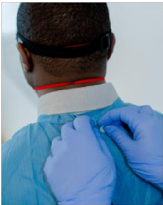
Ryc.15. Zdejmowanie fartucha: chwytanie z tyłu