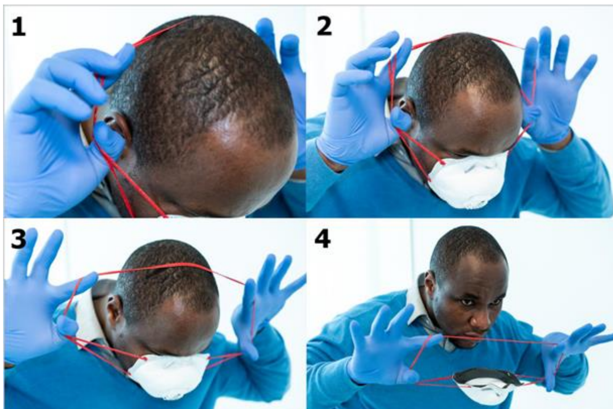
Ryc. 20. Zdjęcie maski (kroki od 1 do 4)

Ostatnimi rzeczami, które należy zdjąć, są rękawice. Przed zdjęciem rękawic należy rozważyć użycie roztworu na bazie alkoholu. Rękawice należy zdjąć zgodnie z procedurą opisaną powyżej. Po zdjęciu rękawic należy wykonać higienę rąk.