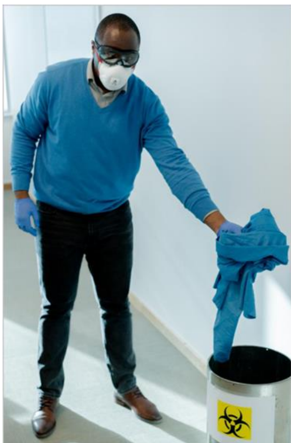
Ryc. 17. Usunąć fartucha do kosza na odpady zakaźne

Fartuchy jednorazowe można teraz zutylizować; fartuchy wielokrotnego użytku należy umieścić w torbie lub pojemniku do dezynfekcji (ryc. 17).