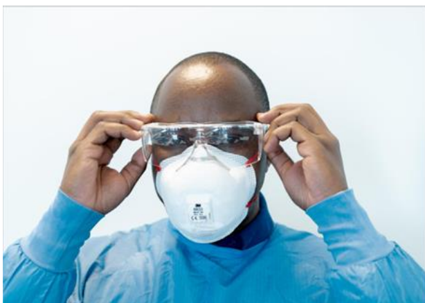
Ryc. 11. Noszenie okularów z zausznikami

Po okularach następane są rękawiczki. Podczas noszenia rękawic ważne jest, aby naciągnąć rękawicę, aby zakryła nadgarstek na mankietach fartucha(ryc. 12). Dla osób uczulonych na