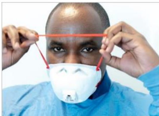
Ryc. 5. Noszenie maski FFP (klasa 2 lub 3)

Metalowy klips na nos musi zostać wyregulowany (ryc. 6), a paski muszą być napięte, aby zapewnić mocne i wygodne dopasowanie.