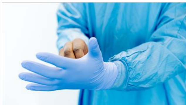
Ryc.12. Noszenie rękawic

rękawice lateksowe powinna być dostępna opcja alternatywna, na przykład rękawiczki nitylowe.