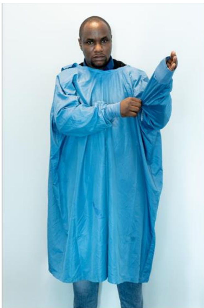
Ryc.3. Zakładanie wodoodpornego fartucha z długim rękawem

Pierwszy element ochrony indywidualnej, jaki należy założyć (ryc. 3), to fartuch. Istnieją różne rodzaje fartuchów (jednorazowego użytku, wielokrotnego użytku); niniejsze wytyczne przedstawiają wodoodporny fartuch z długimi rękawami wielokrotnego użytku. Podczas korzystania z fartucha z zapięciem z tyłu, jak pokazano poniżej, drugi operator powinien pomóc zapiąć guziki z tyłu (ryc. 4).